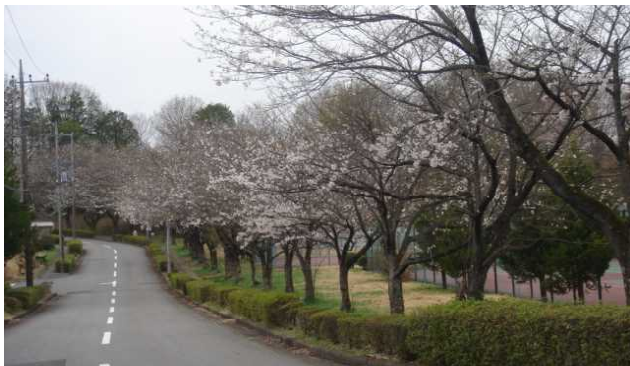
ホテルコリーナ 付近の桜並木

これからも、組合員の助け合い（共助）により、災害の発生を未然に防止し、住みよい環境を維持していくことが重要です。皆様のご理解と、ご協力をお願いいたします。