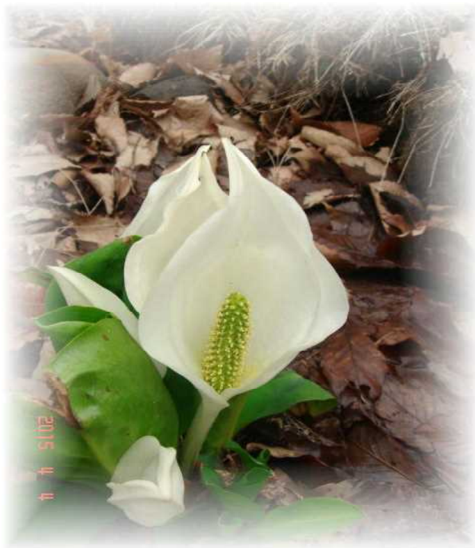
湖沼公園に初めて咲いた ミズバショウ (定植 4年目にて)

今後とも皆様のご意見とご協力を頂きながら、役員、事務員一同努力してまいります。宜しくお願いいたします。