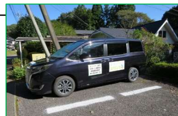
コリント号(事情により代車です)

コリント号は8時15分公民館から予定通り出発しました。当日の利用者は6名でした。ボランティアの運転手さんも慣れないなか安全第一で取組んでいます。10月には、現市営バス停を“コリント号仕様”に変更します。